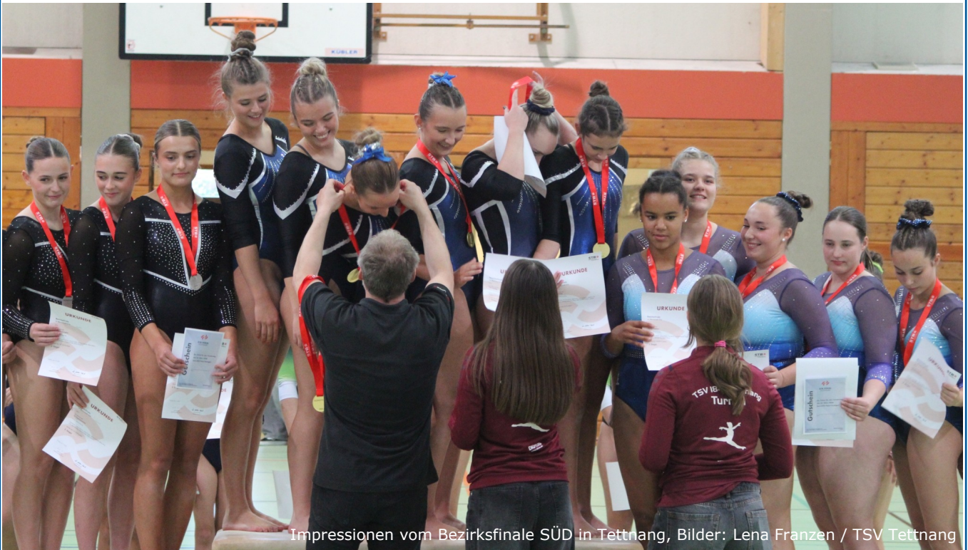
Impressionen vom Bezirksfinale SÜD in Tettang