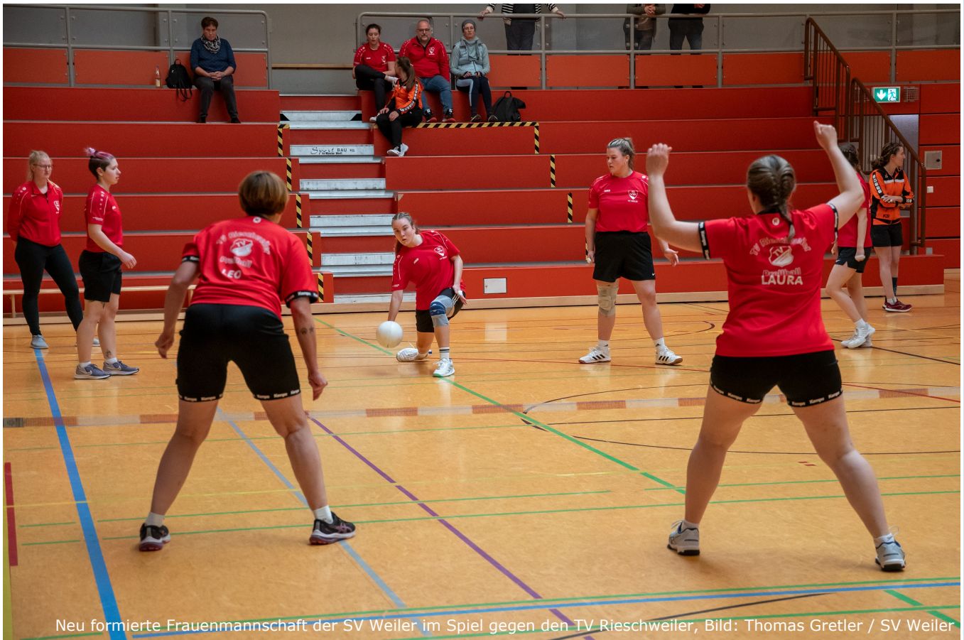
Neu formierte Frauenmannschaft der SV Weiler im Spiel gegen den TV Rieschweiler